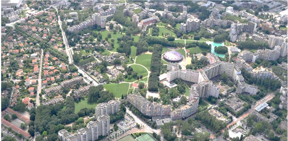
Photo aérienne du secteur de l'Arlequin, le grand parc Jean Verlhac au centre

Le quartier de la Villeneuve, en particulier le secteur de l'Arlequin, a été construit durant les années 1969 à 1972 sur la base d'une utopie urbaine développée par l'Atelier d'Urbanisme et d'Architecture (AUA), rassemblé autour de Jacques Allégret. Il s'organise autour d'un grand parc central, une galerie couverte de distribution et un certain nombre d'équipements publics : groupe scolaires, collèges, commerces, centres sportifs, salles de spectacles. Les équipements sont plutôt tournés vers le parc, tandis que les abords du quartier sont dédiés à la mobilité (nouvelles artères urbaines, parkings aériens et en ouvrages). Le quartier est desservi depuis 1987 par la première ligne de tramway de la Métropole Grenobloise de Grenoble, permettant de rejoindre le centre-ville en moins de 20 minutes.