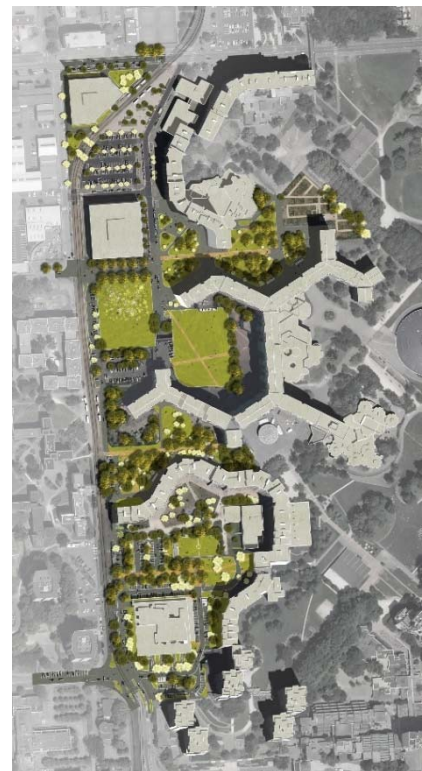
Plan masse

Pour la gestion des eaux pluviales sur ce projet, deux grands types d'ouvrages hydrauliques ont été mis en œuvre : des jardins de pluies et des dépressions engazonnées, parfois associées à des puits d'infiltration. Les jardins de pluies accompagnent les nouvelles rues et les dépressions engazonnées les espaces piétons et les espaces verts.